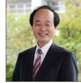
学長 郡 健二郎